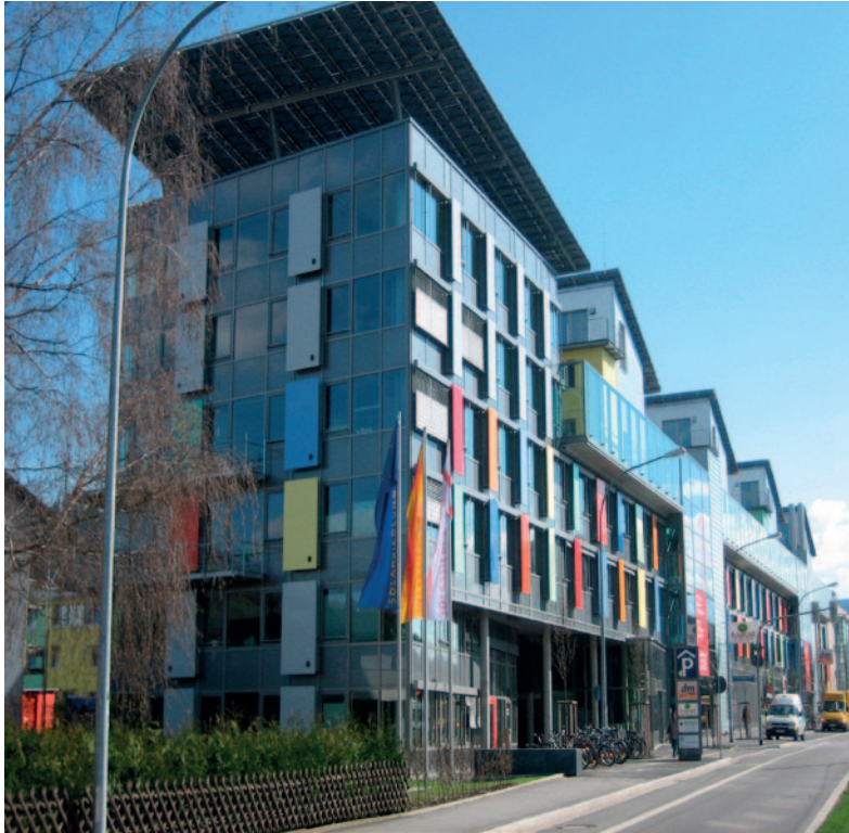
330_Öko Institut Freiburg: REACh-Radar und mehr